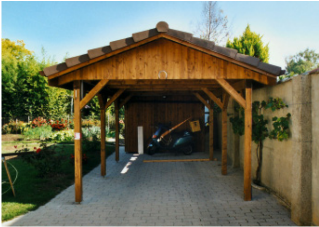
Carport mit Geräteraum

Alle Holzteile behandeln wir im Farbton Ihrer Wahl.