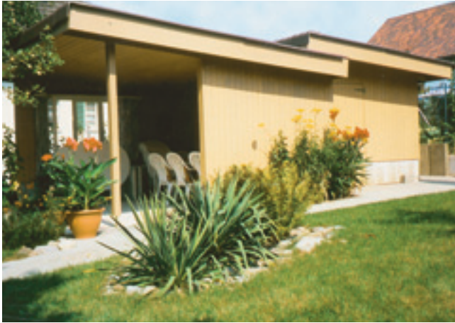
Geräteraum mit Sitzplatz, Pultdach abgesetzt