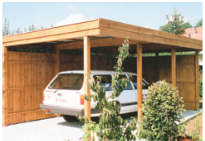
Einzelcarport mit Rück- und Seitenwänden