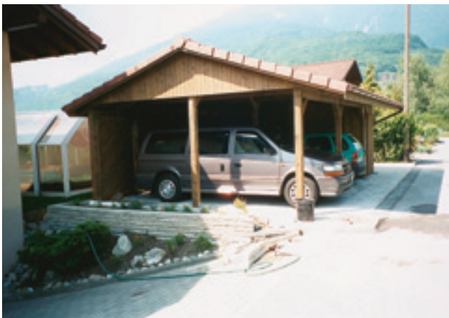
Doppelcarport mit Geräteraum