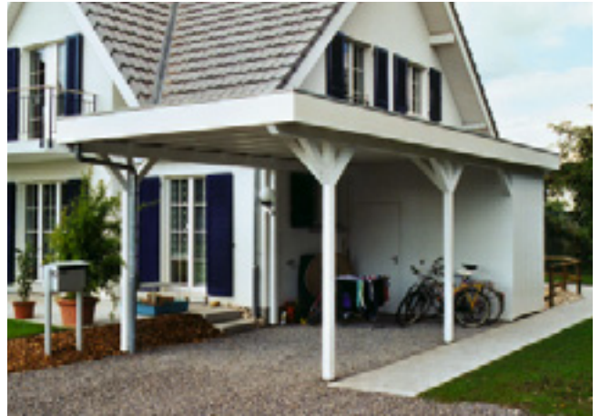
Carport mit Geräteraum