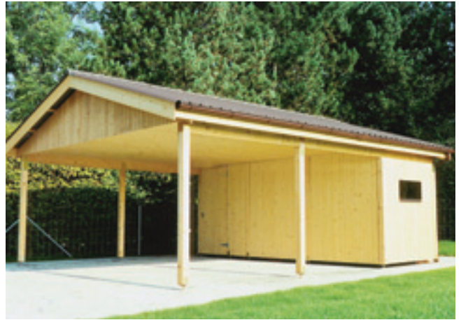
Doppelcarport mit Geräteraum