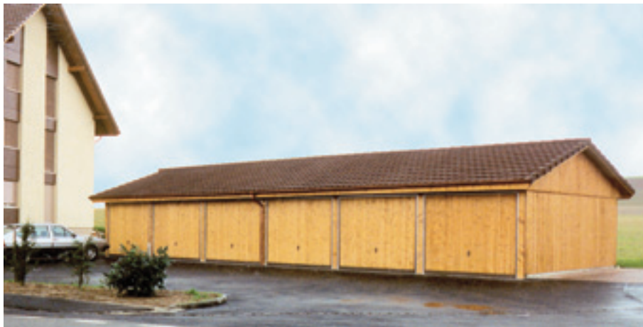
Geschlossene Carport-Anlage mit Kipptoren