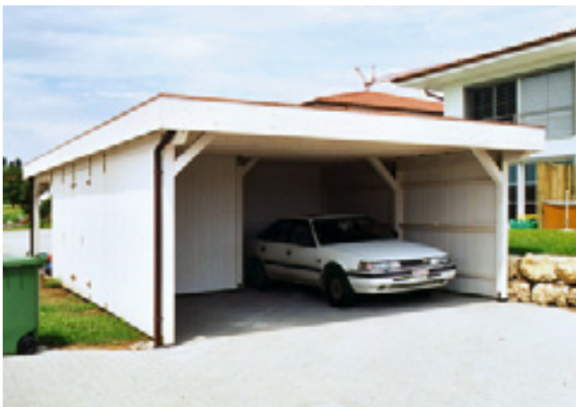
Doppelcarport mit Geräteraum