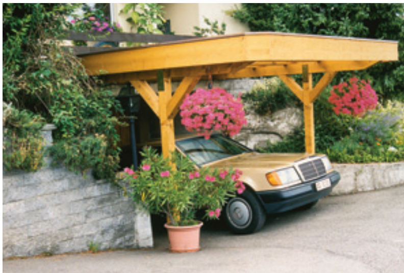
Integrierte Überdachung der Garageneinfahrt