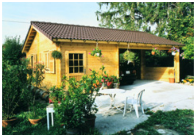
Blockhaus mit integriertem Autounterstand