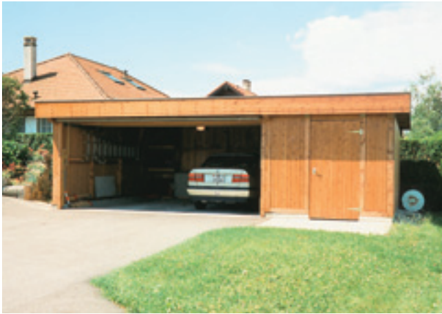
Doppelcarport mit Geräteraum

Alle Holzteile sind in einem Farbton nach Ihrer Wahl behandelt.